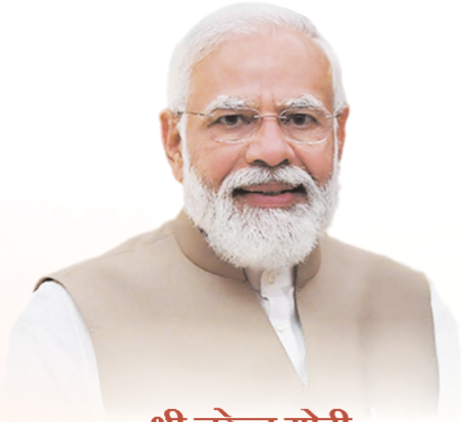
श्री नरेन्द्र मोदी माननीय प्रधानमंत्री