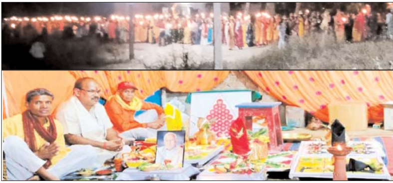
आरती की गई। रात्रि 9 बजकर 31 मिनट पर अखण्ड नवधा रामायण का विधिवत शुभारंभ हुआ।

कार्यक्रम की शुरुआत नवधा चौक से निकली कलश यात्रा से हुई, जो तुरीधाम स्थित शिव मंदिर पहुंची। वहां विधि-विधान से वरुण देव एवं गंगा पूजन के पश्चात भगवान भोलेनाथ की पूजा-अर्चना की गई। तत्पश्चात जल लेकर श्रद्धालु पुनः नवधा चौक पहुंचे, जहां वेदी पूजन एवं अखण्ड ज्योति प्रज्वलन किया गया। इसके बाद भगवान विष्णु, मर्यादा पुरुषोत्तम श्रीराम एवं रामदत्तार का पूजन-अर्चना कर