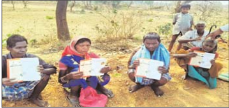
दराअसल आकांक्षी विकासखंड लखनपुर के ग्राम तुमगुरी से जहाँ राष्ट्रपति के दत्तक पुत्रों सहित ग्रामीणों को राशन वितरण में गड़बड़ी का मामला सामने आया है। राशन में वितरण नहीं होने से राष्ट्रपति की दत्तक पुत्र कहे जाने वाले कोरवा जनजाति के लोगों को काफी परेशानियों का सामना करना पड़ रहा है।

अंबिकापुर। लखनपुर विकासखंड खाद्य वितरण प्रणाली में अनियमितता के लिए वैसे तो हमेशा सुर्खियों में रहता है जहाँ कहीं पंचायतों में राशन वितरण में गड़बड़ी सहित कई जगह राशन वितरण में अनियमितता के मामले सामने आते हैं।