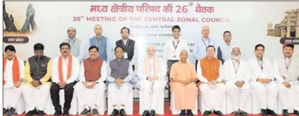
समवेत शिखर संवाददाता

केन्द्रीय गृह मंत्री ने सभी मुख्यमंत्रियों एवं मुख्य सचिवों से कुपोषण के विरुद्ध भारत सरकार की लड़ाई में कंधे से कंधा मिलाकर आगे बढ़ने का आह्वान किया